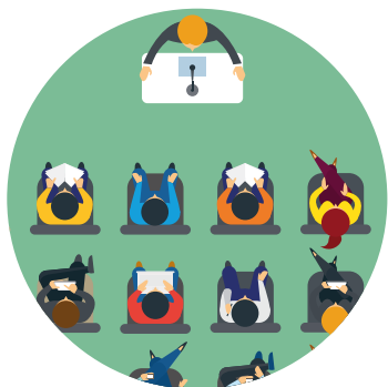
ESCUELA DE PADRES Conferencias y formación