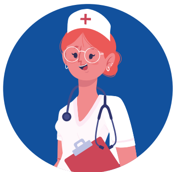
ENFERMERA Asistencia y vigilancia