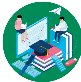
MATERIAL ESCOLAR FUNGIBLE