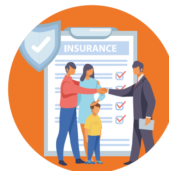
SEGURO ESCOLAR Accidentes y Asistencia Sanitaria