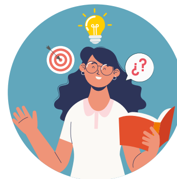
ORIENTACIÓN ESCOLAR Desarrollo del alumnado