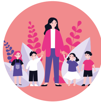
LUDOTECA Navidad / Magdalena / Pascua