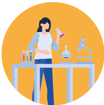
GASTOS DEL AULA Confort, seguridad y tecnología