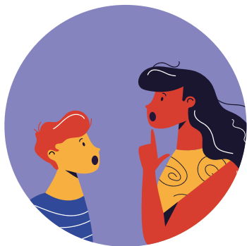
LOGOPEDIA Prevención y detección