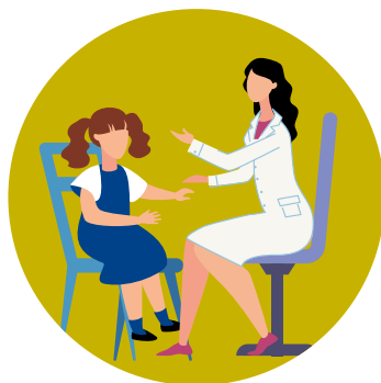
PSICÓLOGA ESCOLAR Atención psicopedagógica