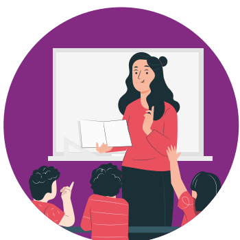
CLASES DE REFUERZO* Apoyo y preparación